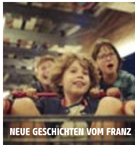
NEUE GESCHICHTEN VOM FRANZ