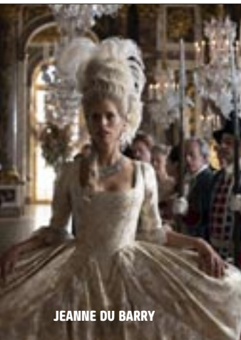
JEANNE DU BARRY